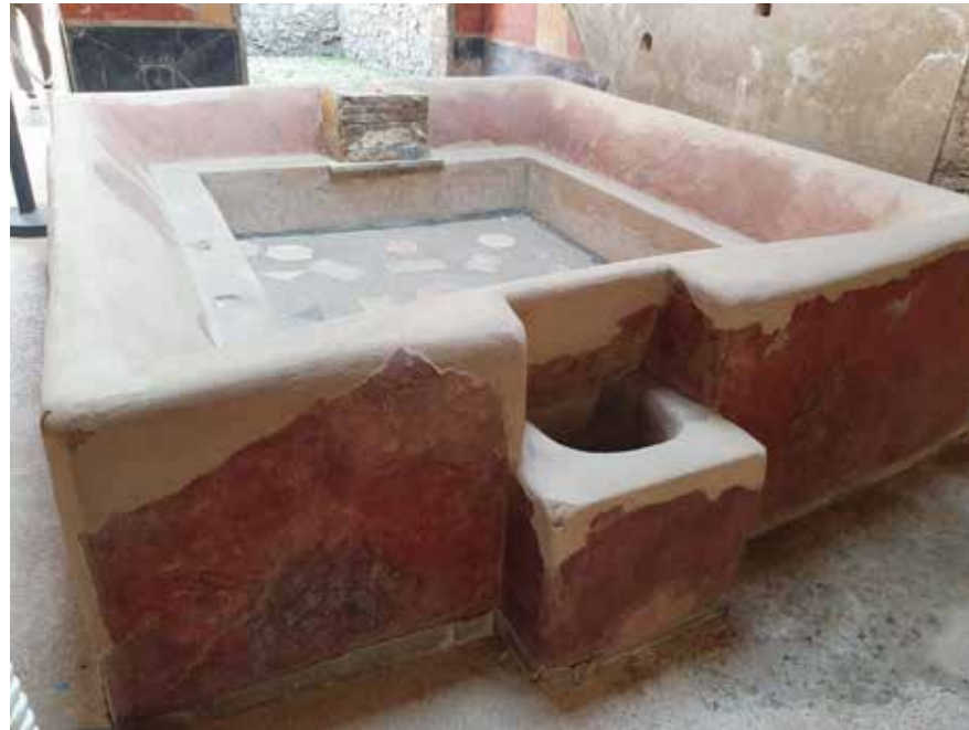
Басейн за пране в обществената пералня