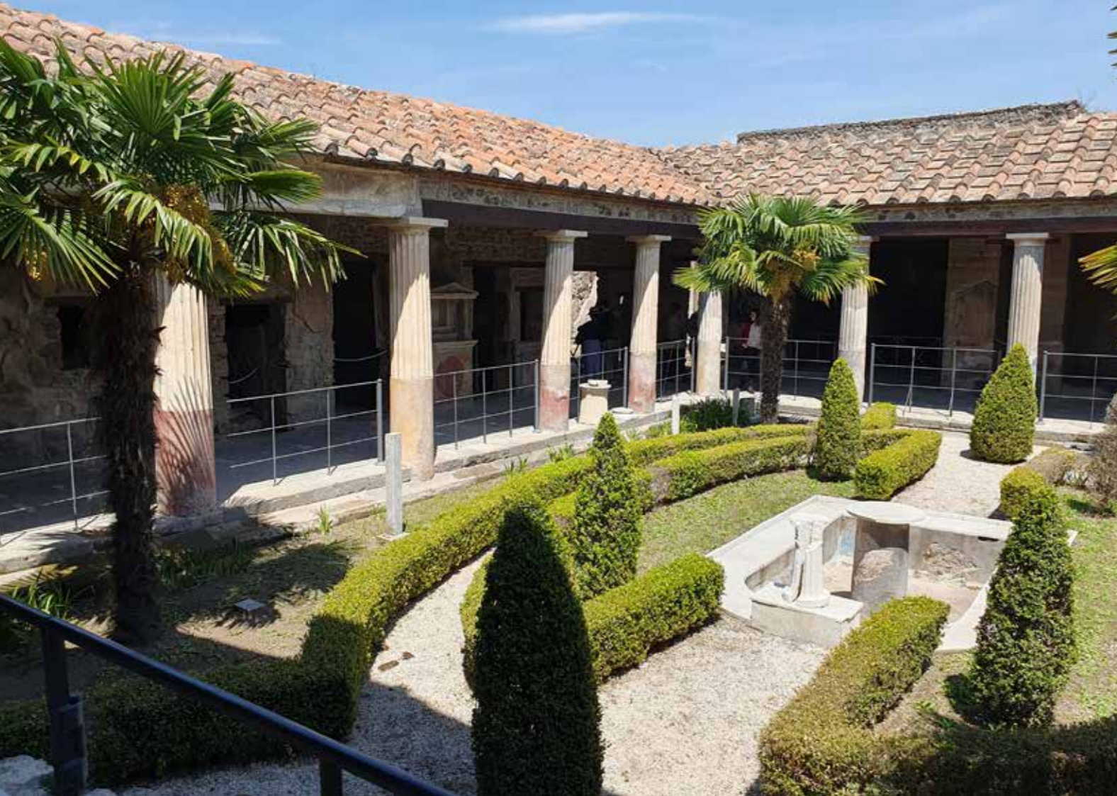
Вътрешен помпейски двор

друга паркова мебел за удобство и поезия. Много е възможно да си бяхте подредили и домашен параклис със статуя на предпочитаното от вас божество от Римския пантеон или символ на онова, което вярвате, че ви носи късмет. В гореописания случай на член на градския елит, но съчетан с принадлежност към мъжкия пол, щяхте да участвате в политическия живот на Помпей. Тогава фасадата на голямата ви и лъскава къща щеше да е превърната в рекламен билборд за вашата кампания.