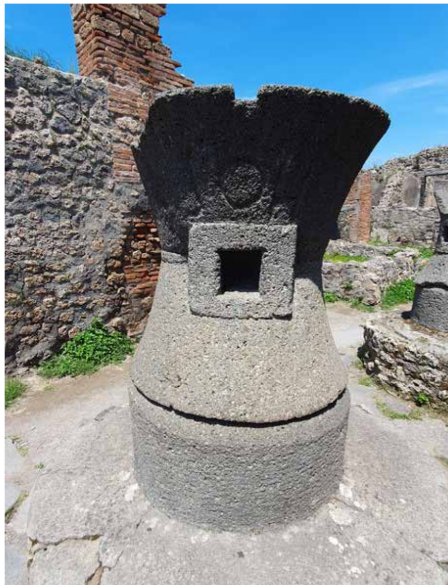
Преса за вино в таберната, или мелница за жито в пекарната

ятно щяхте да се отправите първо към градския форум , централния площад. Обширно пространство, радващо окоото с красива архитектура и статуи на специални герои и божества, то винаги щеше да е пълно с хора и с възможности да срещнете приятели и познати, с които да побъбрите. Това щеше да е мястото, където да научите градските новини. А многобройните храмове, заобикалящи форума, щяха да ви предложат директна връзка с предпочитанията от вас божествен закрилник. От форума щяхте да се отправите към градския амфитеатър . Естествено, не всеки римски град може да разполага със собствен Колизеум, но и в Помпей за забавлението на жителите е отделено доста голямо пространство. Поради равния терен, и тук като в Рим местата за зрителите са издигнати върху нарочно построени арковидни структури. По празници в амфитеатъра щеше да тече богата програма от забавления за народа. Театрални представления щяха да се изнасят в Големия и Малкия театри, разположени един до друг за улеснение, в съседство с голяма градска градина.