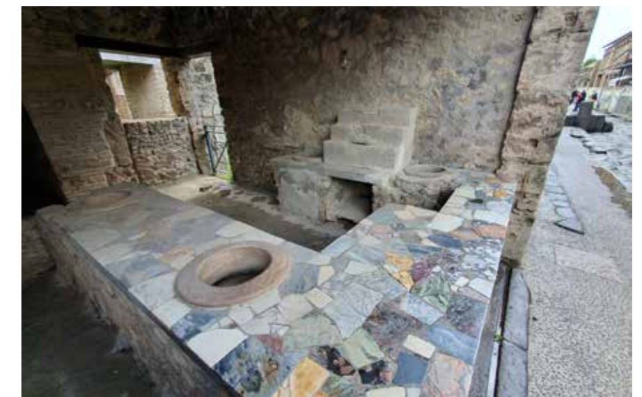
Термополиум, или римската бърза закуска

на с особен вид глина, след което се изплакват, сушат на слънце и кардират с четки, а като допълнителна услуга се и изглаждат с помощта на специална преса. Нахранени, изкъпани и облечени, може би щяхте да се почувствате в нужда от социален живот и забавления. Веро-